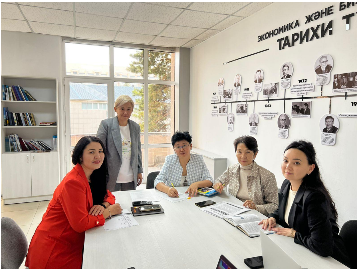
ҚазҰУ платформасында халықаралық дөңгелек үстел өткізілді